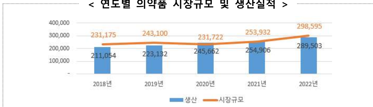
< 연도별 의약품 시장규모 및 생산실적 >

** 의약품 시장규모(억원): ('21년) 25조 3,932 → ('22년) 29조 8,595